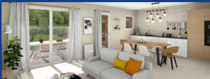
Terrains selon disponibilités des apporteurs.

Projets de construction entièrement personnalisables ! Ces prix comprennent le terrain, la construction, les frais de notaire, les branchements et l'assurance Dommage-Ouvrage.