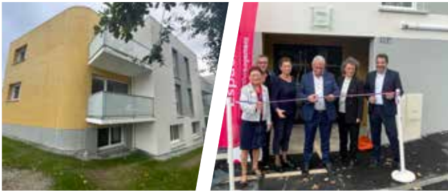
PLUNERET (56), résidence Les Chouans, 30 logements locatifs