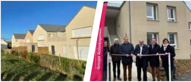
JANZÉ (35), résidence de La Chesnaie, 12 logements locatifs