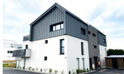
ORGÈRES (35) , résidence Séléna, 8 logements locatifs