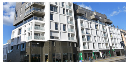
RENNES (35) , résidence Tribeca, 23 logements locatifs