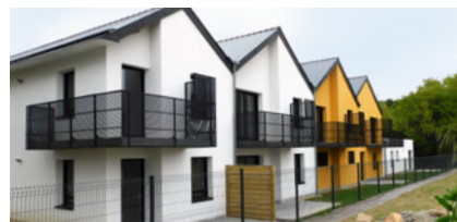
LARMOR-PLAGE (56) , résidence Quinsoy, 14 logements locatifs dont 6 logements inclusifs

Titulaire du droit d'usage des marques :