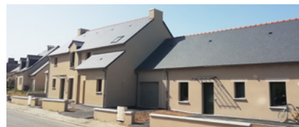
DOMALAIN (35) , résidence du Plessis, 6 maisons locatives