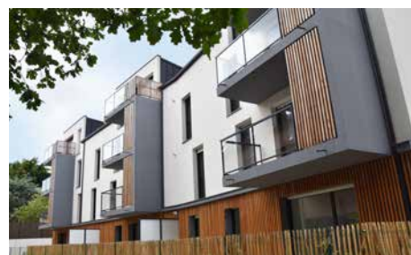
SAINT-GILLES (35) , Maison Helena 23 logements locatifs pour seniors.

Fenêtre Sur n°38 - Juillet 2020 - Directrice de la publication : Sophie Donzel - Journal d'information Espacil Habitat - RCS 302 494 398 - 1 rue du Scorff - CS 54221 - 35042 Rennes cedex - www.espacil-habitat.fr - T 02 99 27 20 00 - Dépôt légal : 2 e trimestre 2020 - Parution 3 fois l'an - Rédaction : Service communication Espacil Habitat - Design graphique : WOSW - 200601 Tirage : 16700 exemplaires - Impression : Imprimerie Allais - Imprimé sur papier certifié PEFC - Distribué gratuitement à tous les locataires et partenaires.