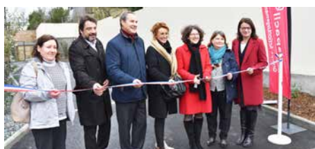
RENNES (35) , résidence Altéa Park 16 logements locatifs.