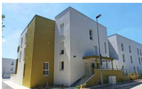
AURAY (56) , résidence Versant Sud 11 logements locatifs.