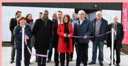
MELESSE (35) , résidence Le Clos de la Piquetière - 6 maisons locatives.