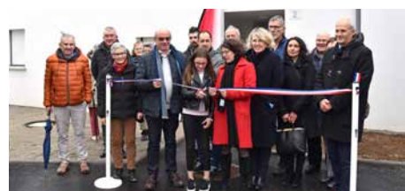
SAINT-PHILIBERT (56) , résidence Lann-er-Mor 8 logements locatifs.